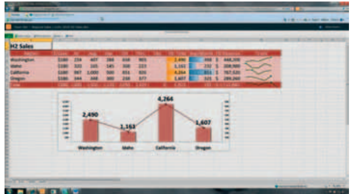
Dokumente im Browser bearbeiten