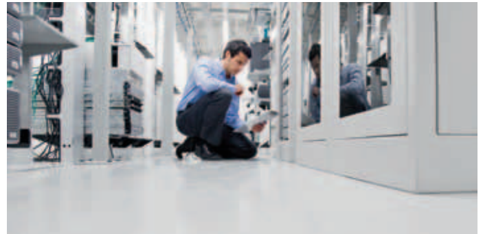
Office 365 wird über professionell geführte Microsoft-Rechenzentren bereitgestellt