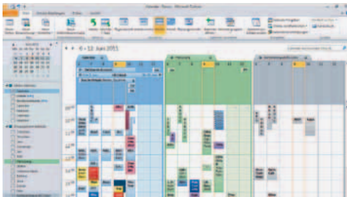
Gemeinsames Kalendersystem für Ihre Firma